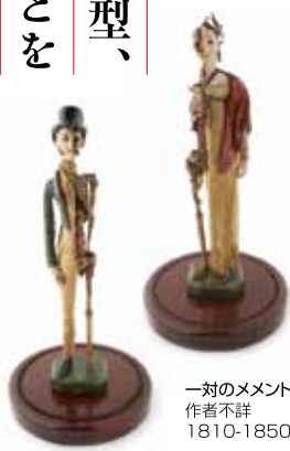
一对のメント・モリ像 作者不詳 1810-1850年頃

収録図版オールカラー、400点以上。 世界中の珍しく貴重な絵画や人体模型、 立体写真、最新電子顕微鏡の画像などを 一堂に集めたかつてないベスト・コレクション!