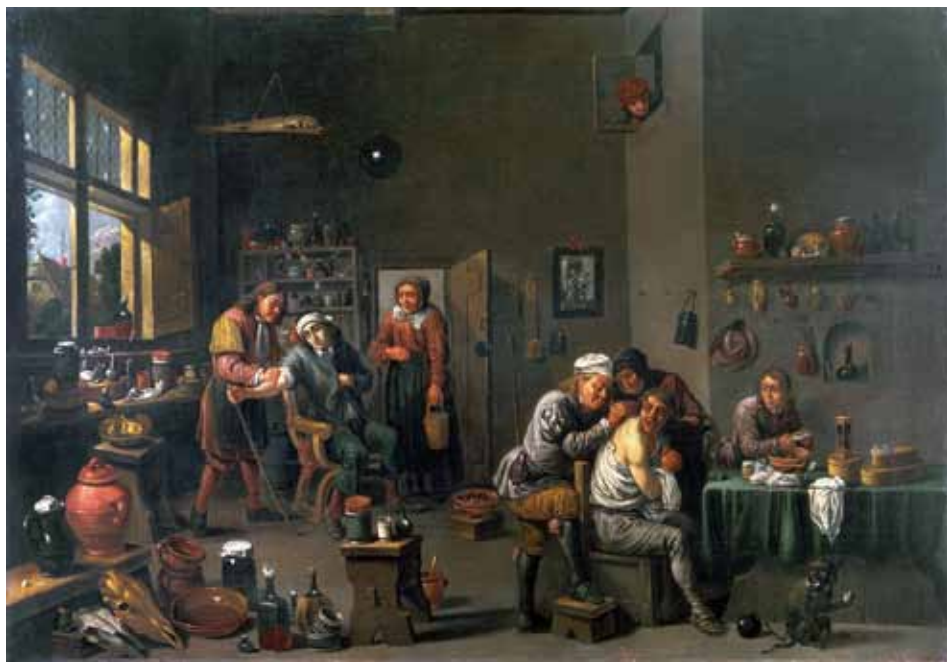
外科診療所の室内 原画はダフィット・テニールス(1610-1690年) 1670年代以降

人体への驚異的な執念—— 解剖学、病理学、薬学、治療法、予防法など、 数千年におよぶ長い医学の進歩と歴史をたどる。